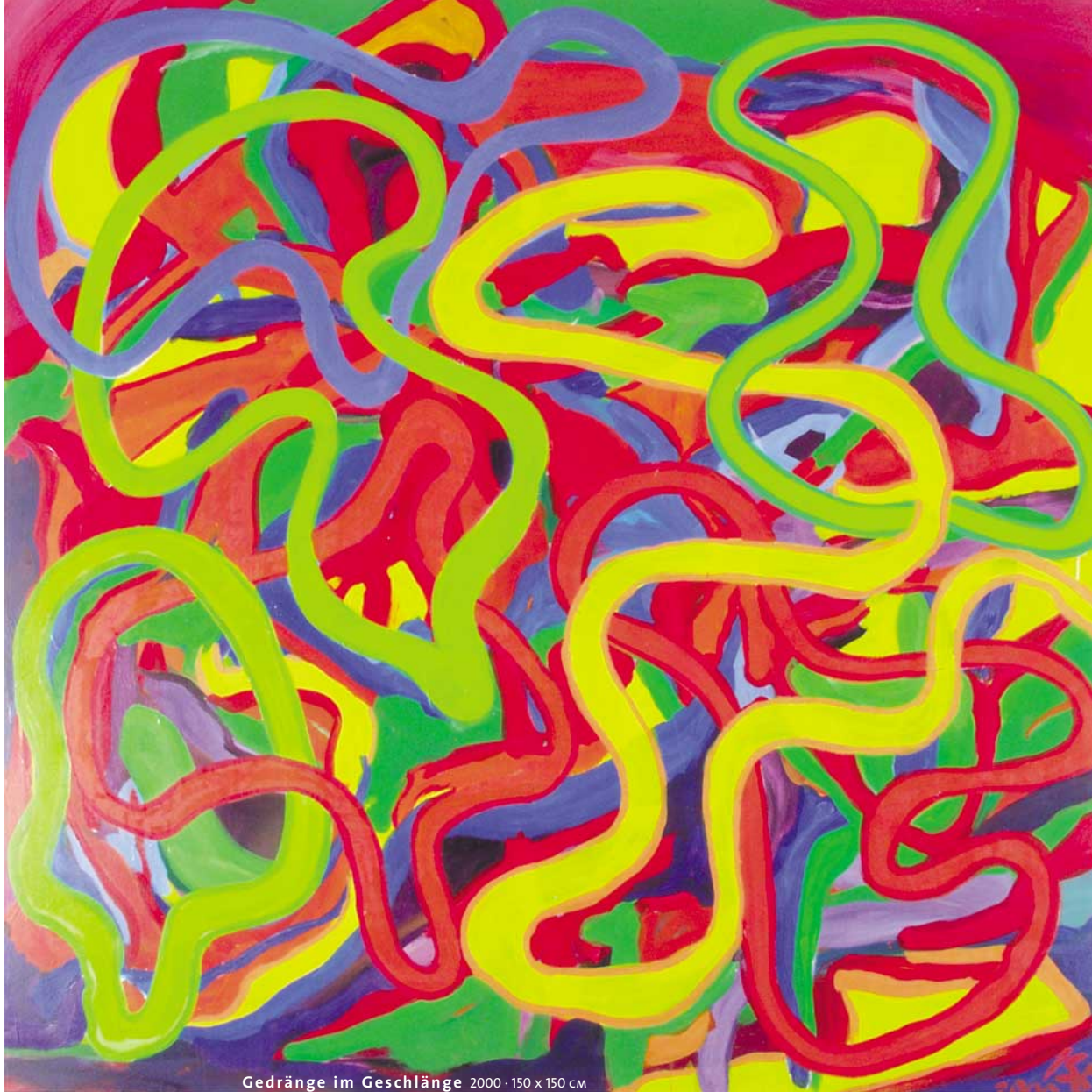
Gedränge im Geschlänge 2000 · 150 x 150 cm