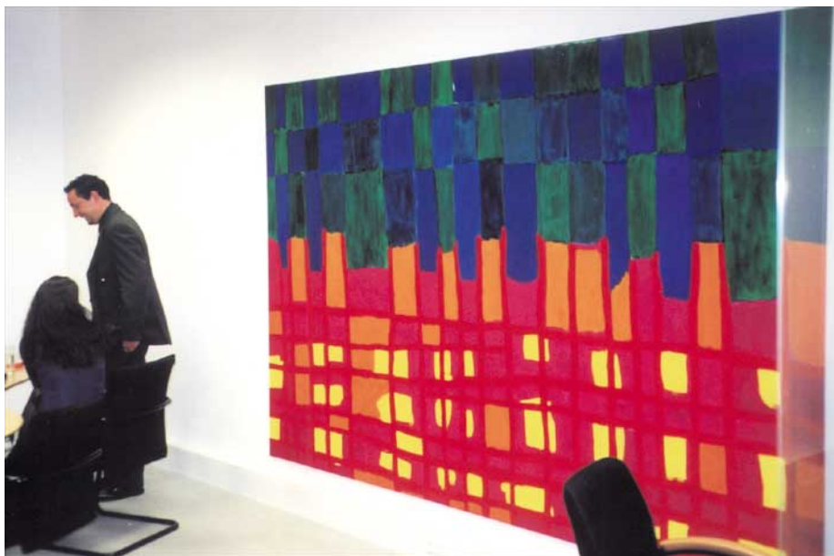
Nachtstadt 2002 200 x 300 cm