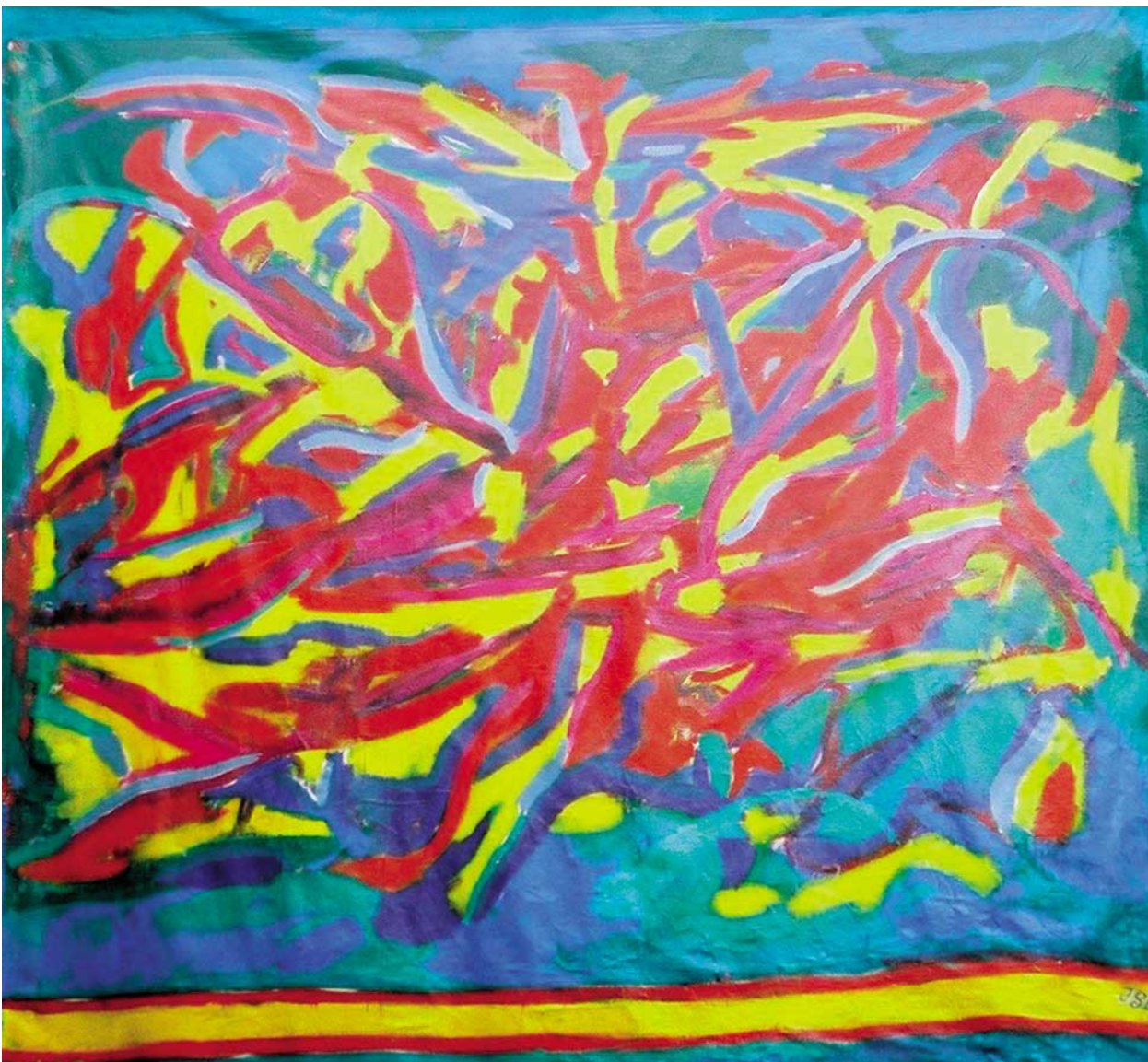
Polop 2002 · 300 x 300 cm