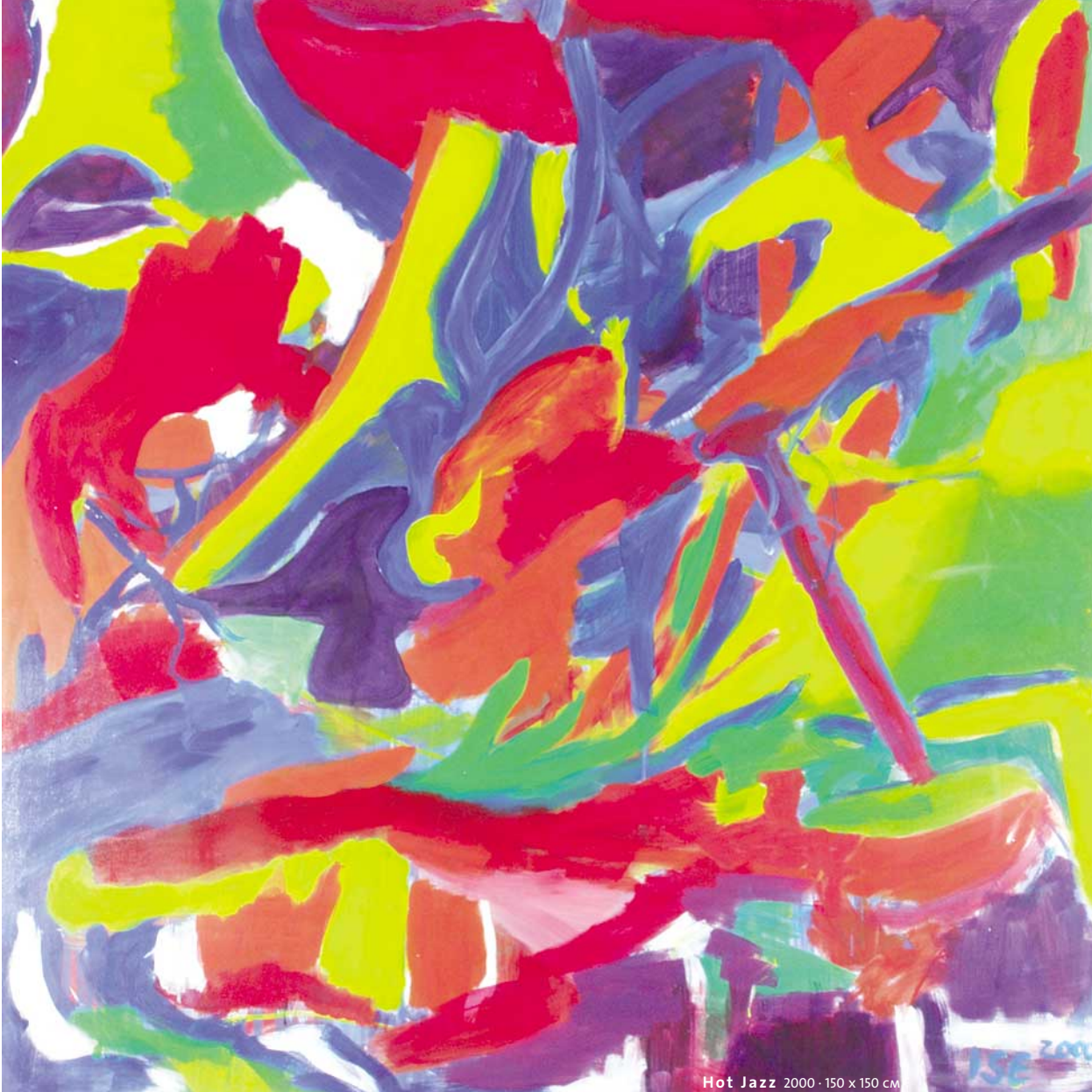
Hot Jazz 2000 - 150 x 150 cm