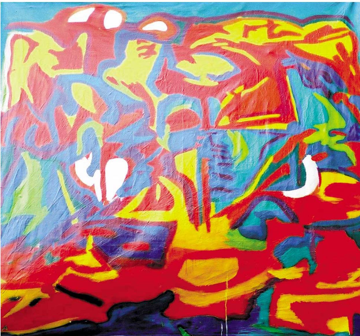
Fiesta 2002 · 300 x 300 cm