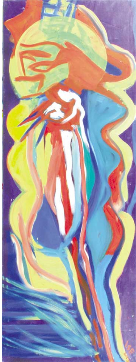
Trance 2002 - 220 x 80 cm